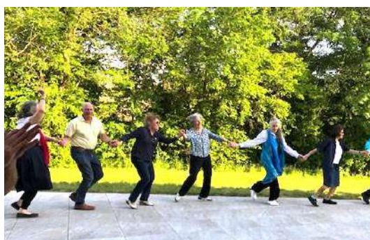
La danse à l'extérieur sur la terrasse