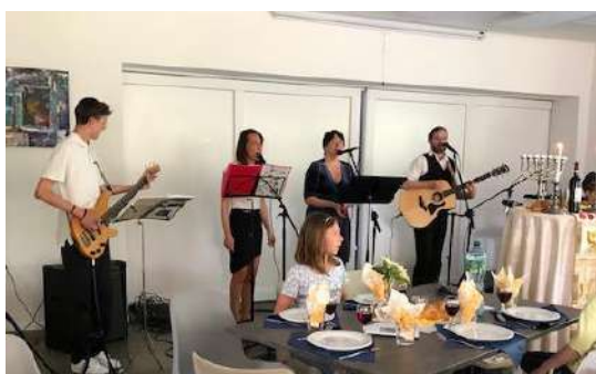
Les musiciens de la Vallée de Joux

Pour en savoir plus : https://www.joelreymond.com/