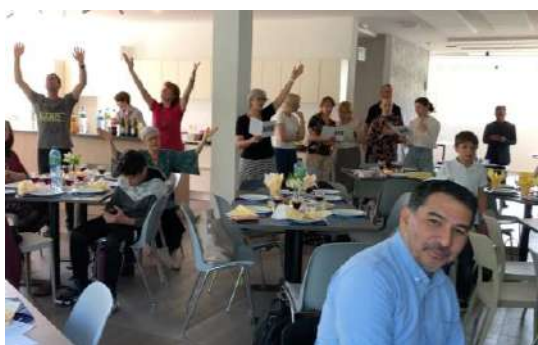
La danse à l'intérieur

Le groupe de la Vallée maîtrise parfaitement les chants typiquement juifs et nous invite à chanter de tout notre cœur.